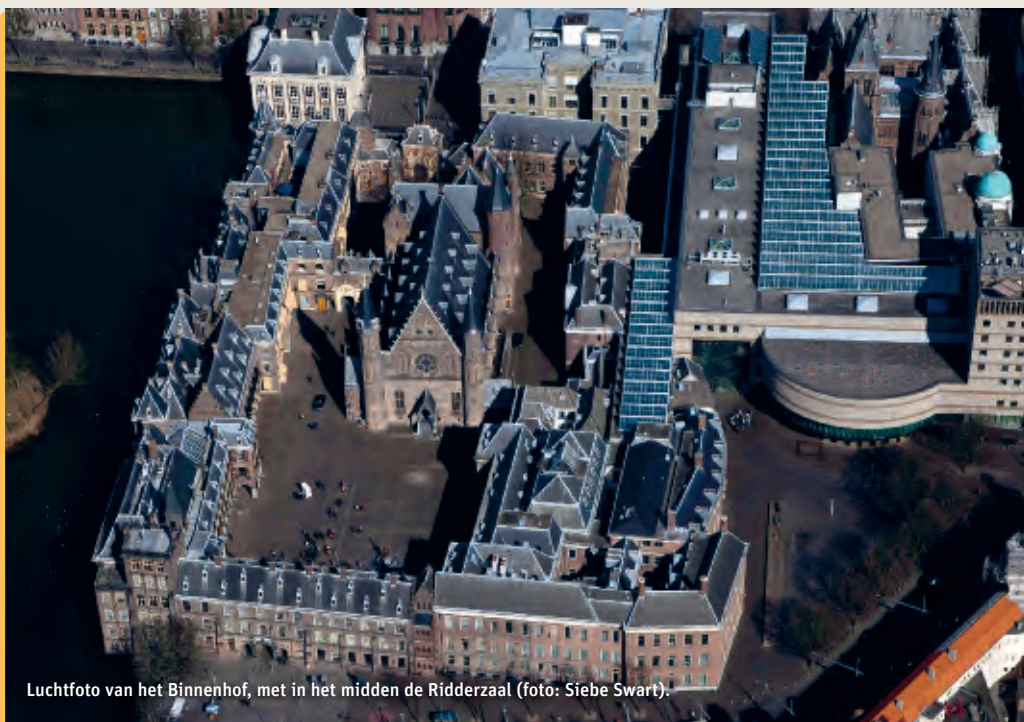
Luchtfoto van het Binnenhof, met in het midden de Ridderzaal.

Tip In de kelder van de Ridderzaal (ingang rechterzijde) is de tentoonstelling De Route van de Gouden Koets te zien, met onder meer een tijdbalk over de geschiedenis van het Binnenhof. Ook staat er een model van ruim 20 meter lang van de koninklijke stoet van Prinsjesdag. De kelder is elke dag geopend van 10 tot ongeveer 17 uur. Voor de zekerheid even bellen is raadzaam (070-7570280). De tentoonstelling is een samenwerking van ProDemos en het Haags Historisch Museum.