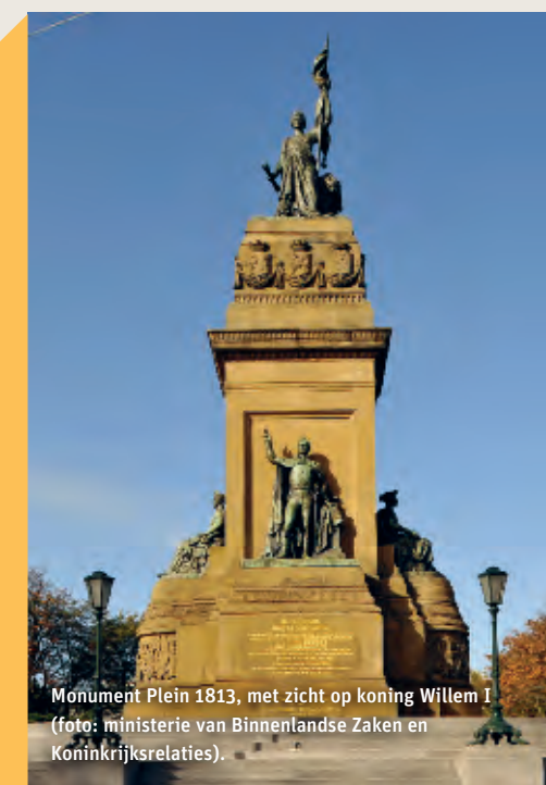
Monument Plein 1813, met zicht op koning Willem I.

Tegenover Paleis Noordeinde staat een negentiende-eeuws gebouw: de Gotische Zaal. Het is in opdracht van koning Willem II in neogotische stijl gebouwd. Koning Willem II was namelijk erg onder de indruk van deze bouwstijl, die hij kende uit zijn studietijd in Oxford. De Gotische Zaal was bestemd voor zijn schilderijenverzameling met werken van Rembrandt, Rafaël, Michelangelo, Titiaan en Rubens. Deze werken heeft de familie later moeten verkopen om de schulden van Willem II af te betalen. De zaal wordt nu onder meer gebruikt voor muziekuitvoeringen. Koning Willem II ontwierp ook nog een marmeren zaal, diverse galerijen, twee torens en een poortgebouw in Engelse neogotische stijl. Op de Gotische Zaal na werden deze vanwege de slechte bouwkundige staat al in 1879 afgebroken.