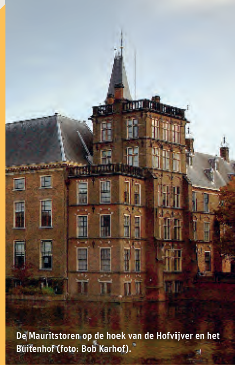
De Mauritsstoren op de hoek van de Hofvijver en het Buitenhof.

Op de hoek van de Hofvijver, schuin voor de Stadhouderspoort, staat een standbeeld van koning Willem II. Tijdens de slag bij Waterloo in 1815 had hij tegen de Fransen gevochten. Hij raakte toen gewond en zijn paard Wexy sneuvelde. Willem was zo aan het beest verknocht dat hij het liet opzetten; vandaag de dag staat Wexy in de Koninklijke Stallen van paleis Noordeinde. Als dank voor zijn inzet bij Waterloo kreeg de kroonprins van de Nederlandse bevolking Paleis Soestdijk aangeboden. In 1816 trouwde hij met Anna Paulowna, de zuster van de Russische tsaar Alexander I. In 1840, een jaar na de Nederlandse erkenning van de onafhankelijkheid van België, volgde hij zijn vader Willem I op als koning der Nederlanden. In 1849 overleed hij.