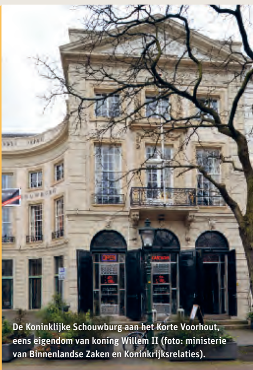
De Koninklijke Schouwburg aan het Korte Voorhout, eens eigendom van koning Willem II (foto: ministerie van Binnenlandse Zaken en Koninkrijksrelaties).

De Koninklijke Schouwburg is de enige schouwburg in Nederland met het predicaat 'Koninklijk'. In 1804 opende de schouwburg haar deuren. Oorspronkelijk bestemd als paleis voor de zwager en zuster van stadhouder Willem V, heeft het lange tijd onafgemaakt leeggestaan, totdat het gebouw op initiatief van een groep cultuurminnende, vooraanstaande Haagse burgers tot schouwburg werd omgevormd. Koning Willem I droeg de schouwburg een warm hart toe en koning Willem II was van 1841 tot 1849 zelfs eigenaar van de Koninklijke Schouwburg. In die tijd stond vooral de Franse opera op het programma. Koning Willem III verkocht de schouwburg in 1853 aan de gemeente. Vandaag de dag is de Koninklijke Schouwburg met haar twee prachtige zalen het onderkomen van het Nationaal Toneel.