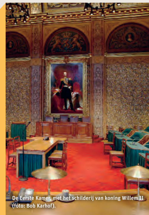
De Eerste Kamer, met het schilderij van koning Willem II.

Het ministerie van Algemene Zaken, het ministerie van de minister-president van Nederland, is met ongeveer 400 medewerkers veruit het kleinste ministerie. Eén van de diensten is de Rijksvoorlichtingsdienst. Het achthoekige torentje op de hoek van het Binnenhofcomplex is wel het meest bekende onderdeel van deze vleugel: het is sinds de jaren tachtig van de vorige eeuw de werkplek van de minister-president. In deze vleugel van het Binnenhof bevindt zich tevens de Trêveszaal, waar sinds 1977 de ministerraad elke vrijdag vergadert. Deze ruimte speelde ook een belangrijke rol in de beginjaren van het koninkrijk: zij diende bijna veertig jaar als vergaderruimte voor de Eerste Kamer. De Trêveszaal, die op de eerste verdieping ligt, is overigens alleen te zien vanaf de overzijde van de Hofvijver.