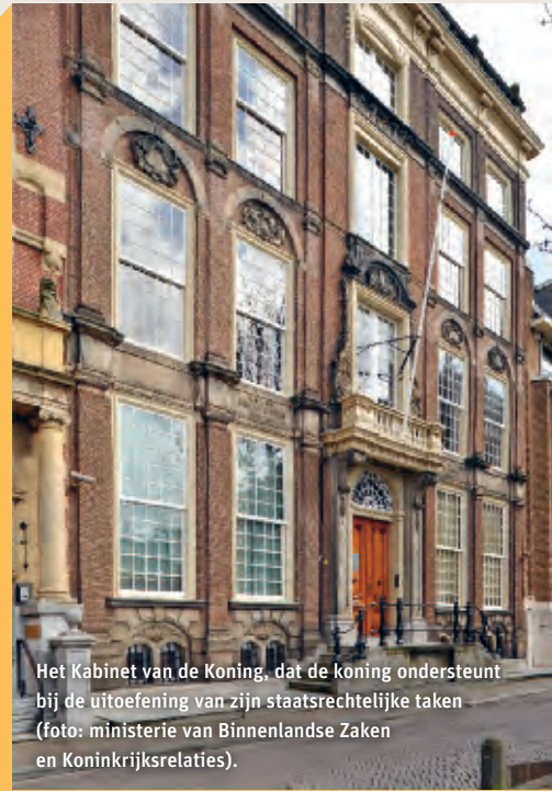
Het Kabinet van de Koning, dat de koning ondersteunt bij de uitoefening van zijn staatsrechtelijke taken (foto: ministerie van Binnenlandse Zaken en Koninkrijksrelaties).

In 1813 kwam er een einde aan de Franse bezetting van Nederland. Het woonhuis van Leopold van Limburg Stirum functioneerde in die dagen als een soort regeringscentrum. Op 17 november 1813 riep het driemanschap een nieuwe regering uit. Prins Willem Frederik van Oranje-Nassau, de zoon van de in 1795 naar Engeland gevluchte stadhouder Willem V, zou hoofd van die regering moeten worden. Den Haag werd oranje versierd. Op 30 november 1813 zette Willem Frederik in Scheveningen voet op Nederlandse bodem. In het huis van Van Limburg Stirum werd hij welkom geheten. Op 30 maart 1814 werd Willem I in de Nieuwe Kerk te Amsterdam ingehuldigd tot soeverein vorst. Op 16 maart 1815 nam hij de koningstitel aan. Daarmee was Willem I de eerste Oranjekoning van Nederland.