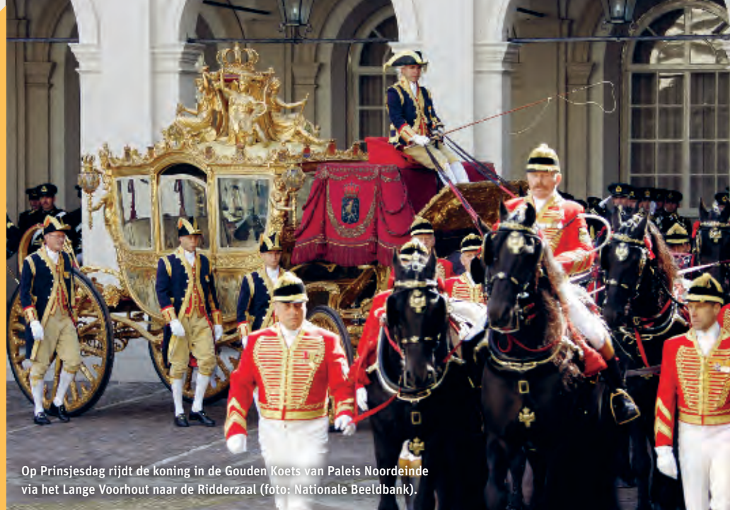
Op Prinsjesdag rijdt de koning in de Gouden Koets van Paleis Noordeinde via het Lange Voorhout naar de Ridderzaal.