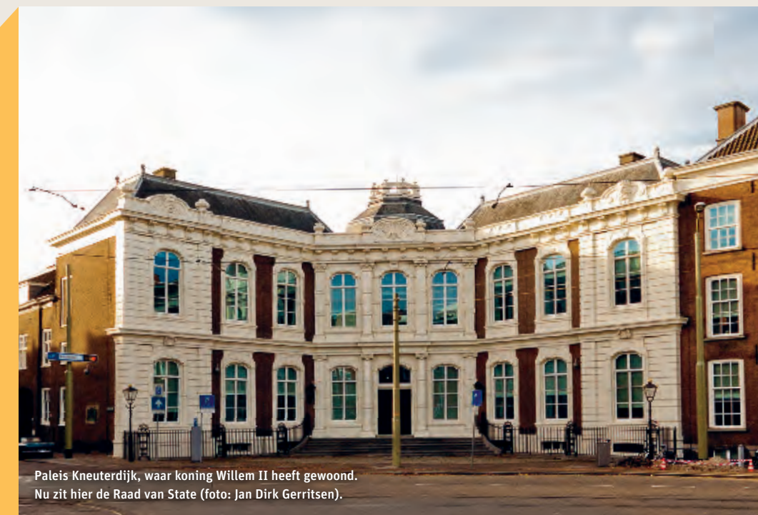
Paleis Kneuterdijk, waar koning Willem II heeft gewoond. Nu zit hier de Raad van State.

Dit voormalige stadspaleis werd in 1716 gebouwd als woonhuis in opdracht van een graaf. In 1816 kwam het gebouw in koninklijk bezit; het was een huwelijksgeschenk voor kroonprins Willem II en Anna Paulowna. Het werd in de jaren 1817–1820 uitgebreid tot een modern paleis. Er kwam een grote balzaal, waar onder meer grote feesten en muzikale soirees werden gehouden. De plaquette in de muur herinnert aan het overleg tussen koning Willem II en zijn adviseurs over de herziening van de grondwet in 1848, dat in dit gebouw plaatsvond. De macht van de koning werd ingeperkt en het parlement kreeg meer te zeggen. In dat jaar werd ook de zogenoemde ministeriële verantwoordelijkheid ingevoerd. De grondwet van 1848 is geschreven door de liberale politicus Johan Rudolph Thorbecke.