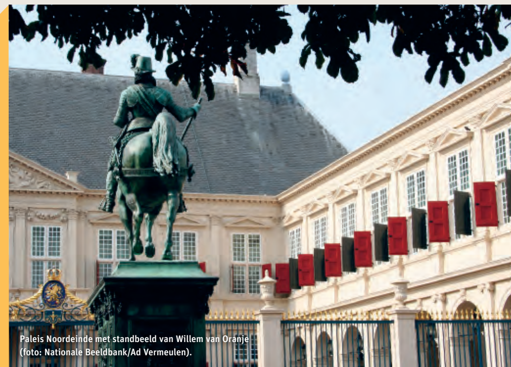
Paleis Noordeinde met standbeeld van Willem van Oranje.