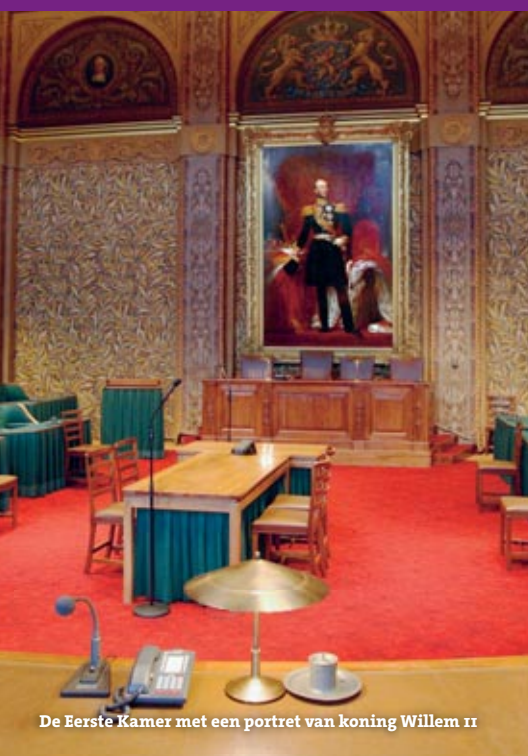
De Eerste Kamer met een portret van koning Willem II