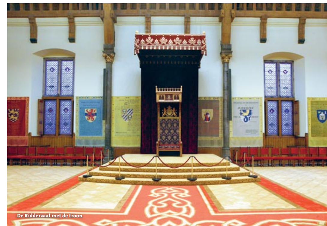
De Ridderzaal met de troon

net, dan is de voorzitter van de Eerste Kamer één van de drie belangrijkste politieke adviseurs van de koningin. Op Prinsjesdag leidt de voorzitter van de Eerste Kamer de ceremonie in de Ridderzaal. Gezien vanaf de Hofvijver ligt zijn werk-kamer links van de vergaderzaal van de Eerste Kamer.