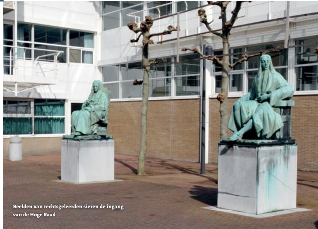
Beelden van rechtsgeleerden sieren de ingang van de Hoge Raad

advies als er een nieuwe regering moet komen. De Raad van State oefent volgens de grondwet zelfs het koninklijk gezag uit als er geen koning of regent is. Je zou dus eigenlijk kunnen zeggen dat de Raad delen van de wetgevende, de uitvoerende en de rechterlijke macht in zich verenigt. Uit hoofde van zijn functie wordt de vicepresident ook wel eens de 'onderkoning van Nederland' genoemd. Overigens vinden de vergaderingen van de Raad over wetgevingsadviezen elke woensdag in de Volle Raadzaal op Binnenhof 1 (tegenover de Ridderzaal) plaats.