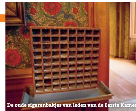
De oude sigarenbakjes van leden van de Eerste Kamer

De Eerste Kamer vergadert sinds 1849 in de vroegere zaal van de Staten van Holland, die zich op de eerste verdieping van het gebouw bevindt. De zaal is alleen zichtbaar vanaf het Buitenhof of de overkant van de Hofvijver. De Eerste Kamer telt 75 leden, die worden gekozen door de leden van de Provinciale Staten. Anders dan de naam misschien doet vermoeden, heeft de Eerste Kamer minder bevoegdheden dan de Tweede Kamer. Zo kan de Eerste Kamer geen wetsvoorstellen wijzigen maar ze alleen in hun geheel goed- of afkeuren. Ze geeft als het ware een eindoordeel over een wetsvoorstel. Ook kan de Eerste Kamer zelf geen wetsvoorstellen indienen. De leden van de Eerste Kamer komen op dinsdag bijeen om te vergaderen. Deze vergaderingen zijn openbaar. De voorzitter van de Eerste Kamer stelt de agenda van de Kamer op. En als er een nieuwe regering moet komen, bijvoorbeeld na verkiezingen of na de val van een kabi-