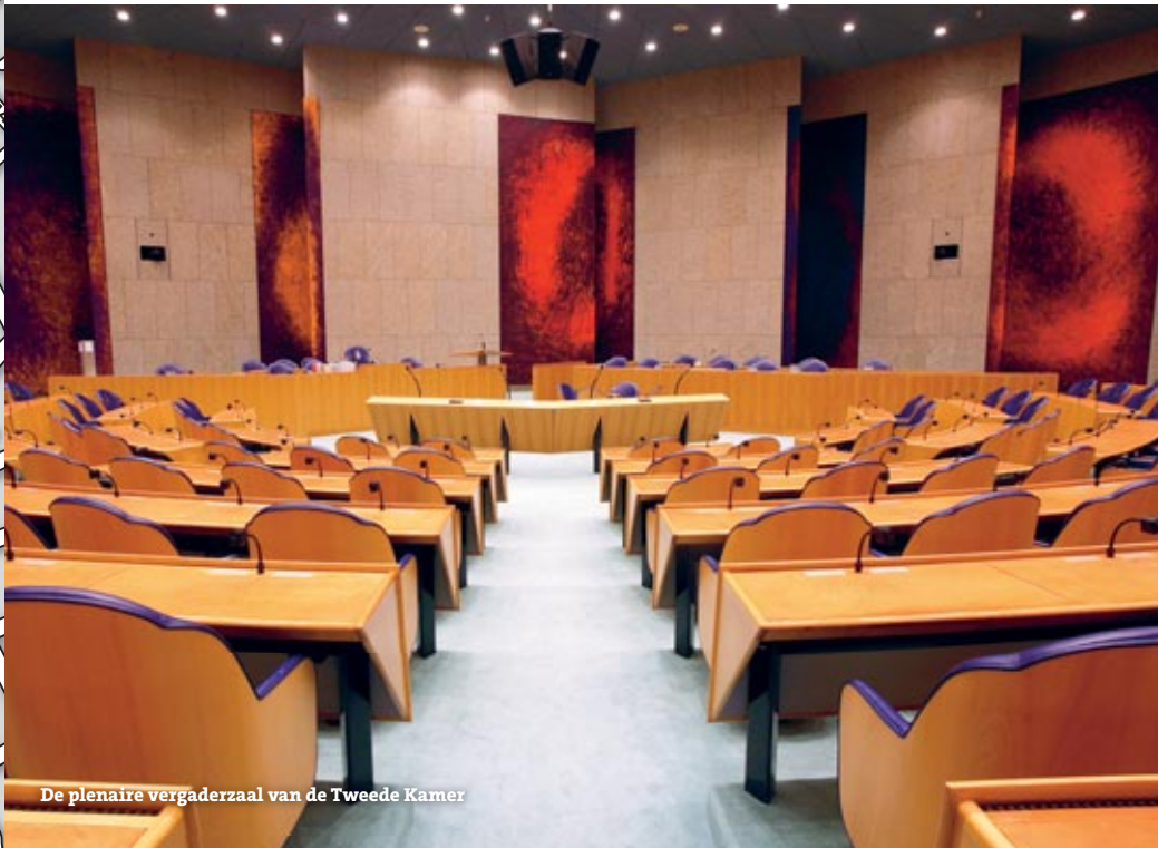
De plenaire vergaderzaal van de Tweede Kamer