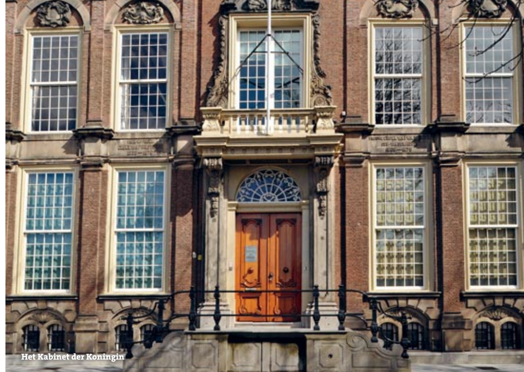
Het Kabinet der Koningin

en/of regeringsleiders is zijn invloed de laatste jaren toegenomen, maar in de regering zelf heeft de Nederlandse minister-president lang niet zoveel macht en gezag als de Duitse bondskanselier of de Britse premier. Omdat de koningin officieel ook deel uitmaakt van de regering, gaat de minister-president elke maand een paar keer bij de koningin op de thee om haar te informeren over de actuele politieke stand van zaken. Maar om te kunnen regeren heeft de regering niet het vertrouwen en de goedkeuring nodig van de koningin, maar van de meerderheid van de leden van de Tweede Kamer.