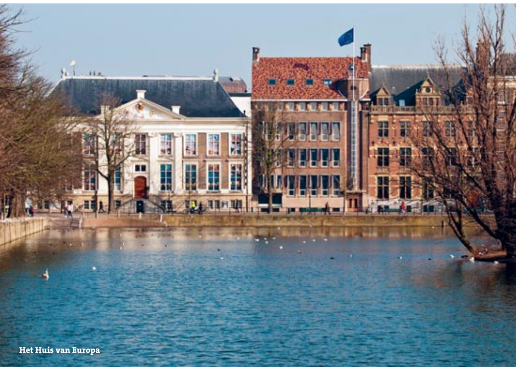
Het Huis van Europa

het initiatief nemen om nieuwe wetten te maken. Daar staat tegenover dat het Parlement wel zeggenschap heeft over de begroting van de EU. Ook de samenstelling van de Europese Commissie, zeg maar het dagelijks bestuur van de EU, moet door het Parlement worden goedgekeurd. Voor veel mensen is Europa een ver-van-mijn-bedshow – van anderen krijgt Europa de schuld van allerhande ongerief. Om de burgers beter voor te lichten, heeft het Europees Parlement daarom een Informatiebureau in Nederland, gevestigd in het Huis van Europa.