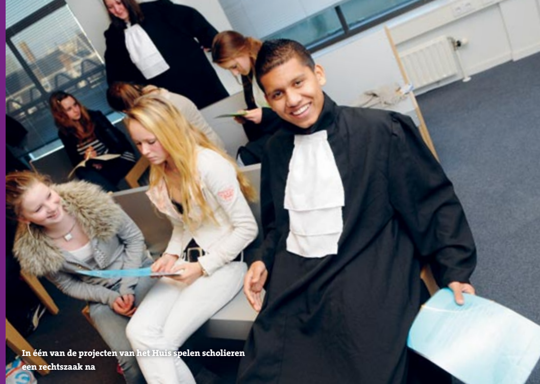
In één van de projecten van het Huis spelen scholieren een rechtszaak na

Hoe is het in Nederland in grote lijnen geregeld? Welke instellingen zijn er en wie geeft daar leiding aan? Anders gezegd: wie zijn onze machthebbers en waar zitten ze precies? Om dat te weten te komen, maken we een korte wandeling over en om het Binnenhof. Niet alle instellingen die iets over Nederland te zeggen hebben zitten echter in Den Haag. Zo is Nederland lid van de Europese Unie (EU). En het centrum daarvan ligt in Brussel. In deze wandeling moeten we het daarom even doen met de kantoren die namens de EU in Nederland werken.