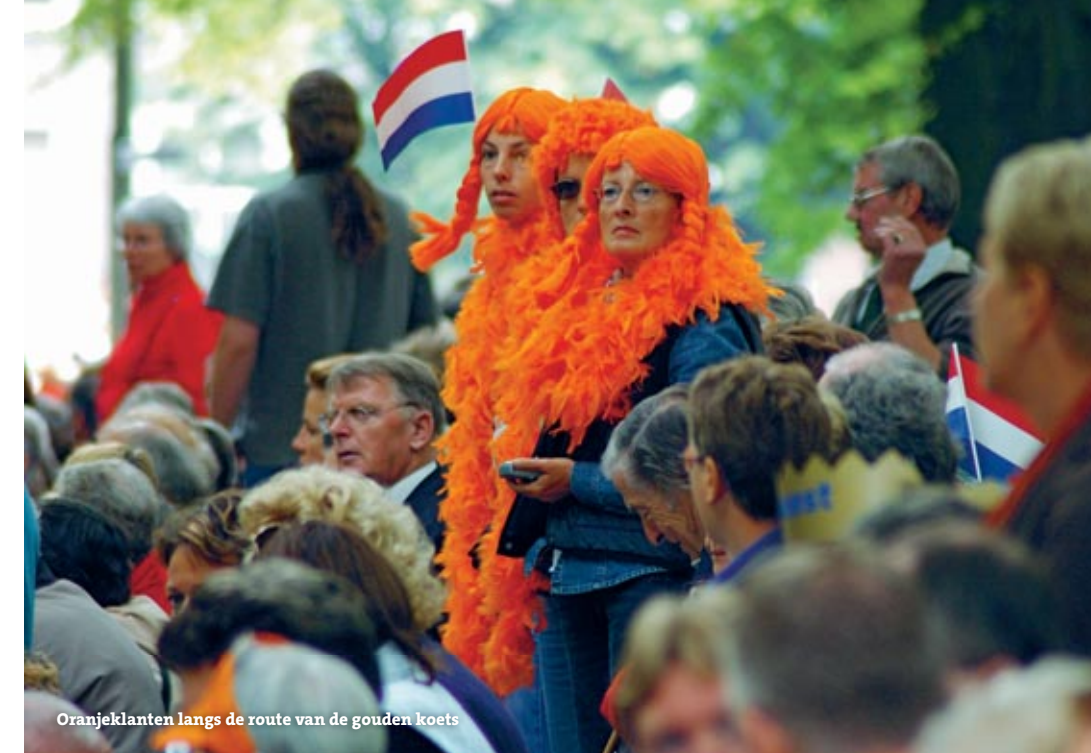
Oranjeklanten langs de route van de gouden koets

Het ministerie van Financiën, dat in de aanloop naar Prinsjesdag een voorname rol speelt, is verantwoordelijk voor het financieel-economische beleid in Nederland. Andere taken zijn het beheer van 's Rijks schatkist en het beleid rond de financiële markten. De bekendste taak van het ministerie van Financiën is wellicht de belastingheffing. Belastingen vormen namelijk de belangrijkste bron van inkomsten van de overheid. Op Prinsjesdag biedt de minister van Financiën aan de Tweede Kamer de miljoenennota en de rijksbegroting aan. Dat doet hij in een perkamenten koffertje, dat van binnen is bekleed met blauwe zijde. De rijksbegroting wordt vervolgens in de Tweede Kamer per ministerie behandeld. Na behandeling en goedkeuring door de Kamer is de begroting van een ministerie wet geworden.