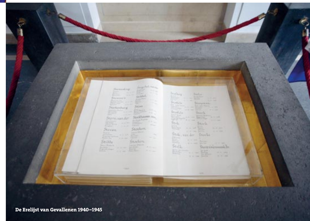
De Erelijst van Gevallenen 1940–1945

Voor de Ridderzaal stapt de koningin uit de gouden koets en betreedt zij onder de klanken van het Wilhelmus de Ridderzaal. Daar neemt zij plaats op de troon en spreekt zij de troonrede uit. De troonrede is een samenvatting van de plannen van de regering voor het komende jaar. In de zaal zitten niet alleen de leden van het parlement (Eerste Kamer en Tweede Kamer der Staten-Generaal) en van het kabinet, maar ook rechters, vertegenwoordigers van allerlei organisaties, ambassadeurs van andere landen en een paar gewone burgers. Als de koningin is uitgesproken, roept de voorzitter: Leve de koningin! En alle aanwezigen roepen vervolgens drie keer in koor: Hoera! Na het voorlezen van de troonrede trekt de koningin zich kort terug in de zogenoemde Koninginnekamer, het zijgebouw links van de hoofdingang van de Ridderzaal. Ten slotte keert zij terug naar Paleis Noordeinde voor de hierboven genoemde balkonscene.