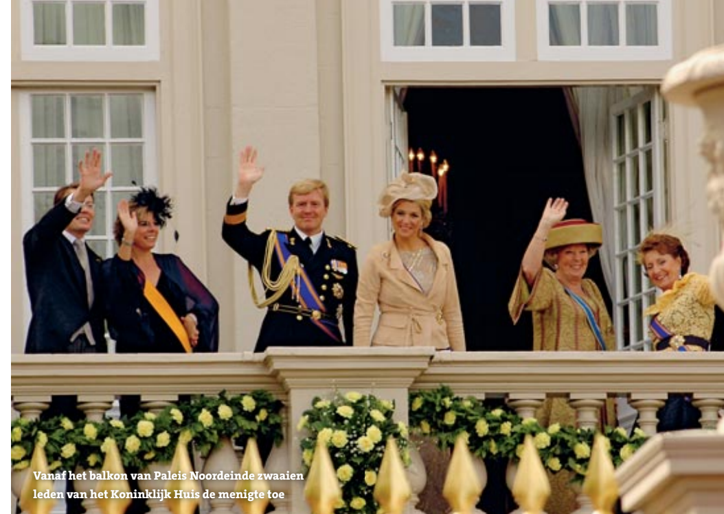
Vanaf het balkon van Paleis Noordeinde zwaaien leden van het Koninklijk Huis de menigte toe

ters. Op grond van al deze adviezen geeft de koningin vervolgens een opdracht aan een informateur om de mogelijkheden te onderzoeken voor de vorming van een kabinet. Later benoemt zij de formateur, die de regering moet vormen. Ondertekening van wetten en andere regeringsstukken en de gesprekken met haar adviseurs vinden doorgaans op Paleis Noordeinde plaats. De koningin ontvangt ook geregeld politici in haar woonverblijf Huis ten Bosch. Daar vindt ook de beëdiging van de ministers van een nieuwe regering plaats. Verder heeft de koningin vooral ceremoniële taken. Tot Paleis Noordeinde behoren ook de Koninklijke Stallen aan de Hogewal: de standplaats van de gouden koets en andere rijtuigen van het Koninklijk Huis. Ook de paarden hebben hier onderdak.