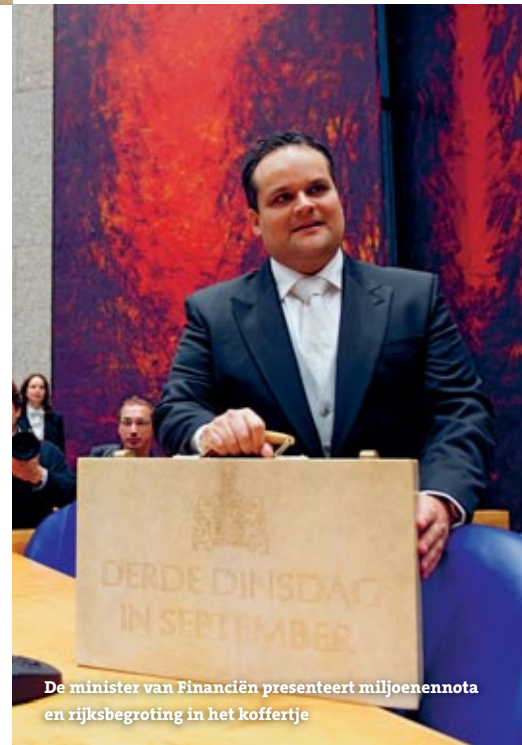
De minister van Financiën presenteert miljoenennota en rijksbegroting in het koffertje

zaken. Maar om te kunnen regeren heeft de regering niet het vertrouwen en de goedkeuring nodig van de koningin, maar van de meerderheid van de leden van de Tweede Kamer.