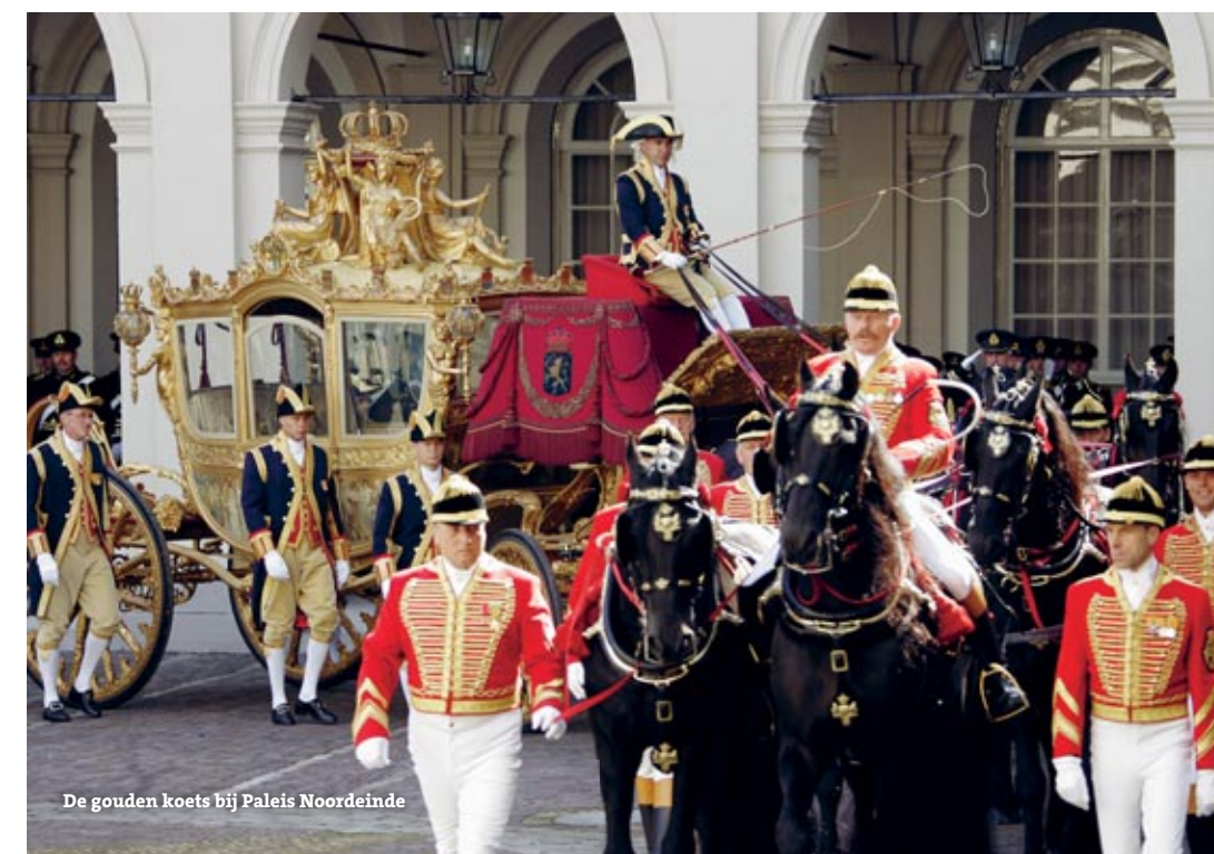
De gouden koets bij Paleis Noordeinde

In 1813 kwam er een einde aan de Franse bezetting van Nederland. In november van dat jaar nam het driemanschap Gijsbert Karel van Hogendorp, Frans Adam van der Duyn van Maasdam en Leopold van Limburg Stirum voorlopig het Algemeen Bestuur op zich. Het woonhuis van laatstgenoemde functioneerde in die dagen als een soort 'regeringscentrum'. Op uitnodiging van het driemanschap kwam prins Willem Frederik van Oranje-Nassau, de zoon van de in 1795 naar Engeland gevluchte stadhouder Willem V, terug naar Nederland. Hij zette op 30 november 1813 in Scheveningen weer voet op Nederlandse bodem. Op het balkon van het huis van Van Limburg Stirum werd hij welkom geheten door het Nederlandse volk. Op 30 maart 1814 werd Willem I in de Nieuwe Kerk te Amsterdam ingehuldigd tot soeverein vorst. Op 16 maart 1815 nam hij de koningstitel aan. Willem I was daarmee de eerste Oranjekoning van Nederland.